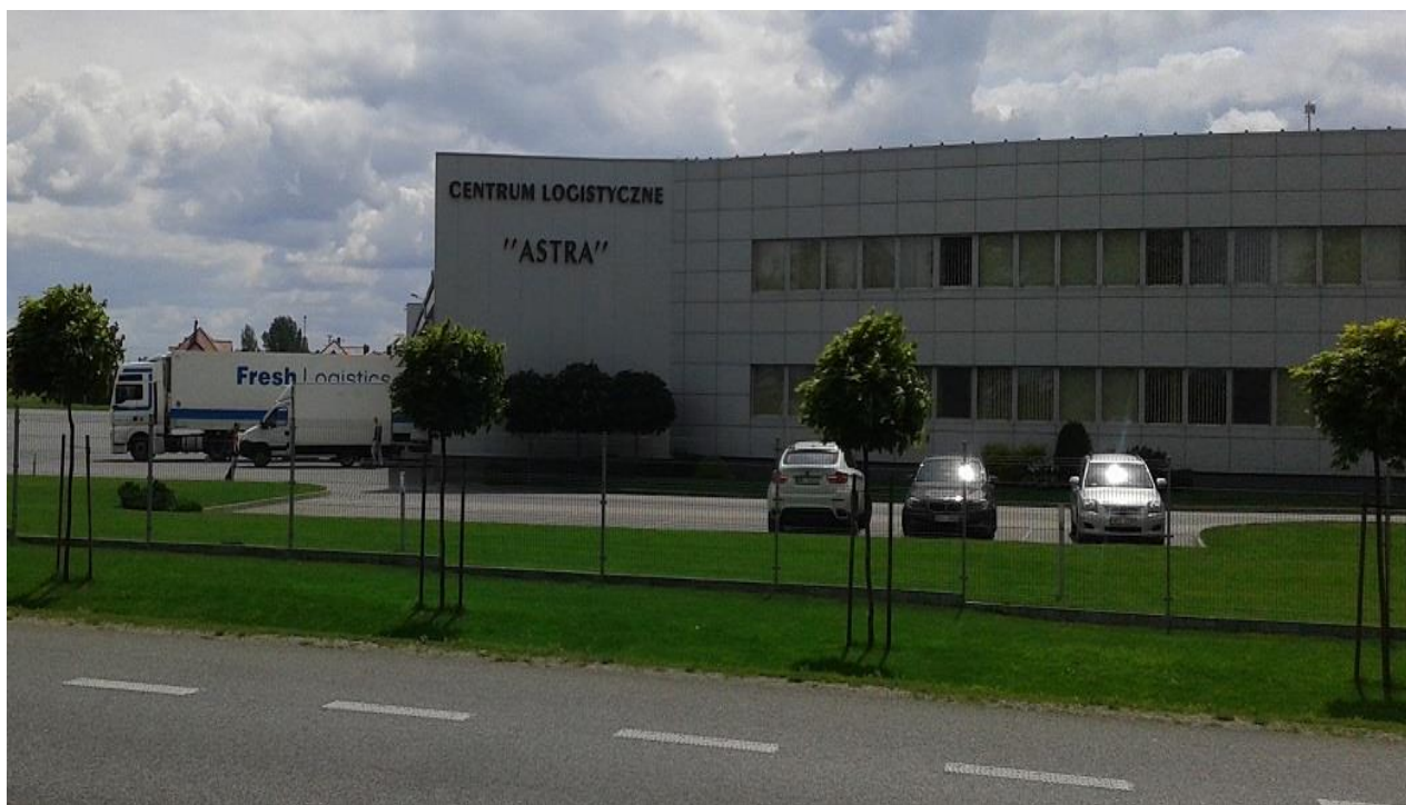
Siedziba Firmy ASTRA Logistyka Sp. z o.o. w Starym Opolu

Spółka Astra Logistyka powstała w 1991 roku. Od samego początku swojego działania na rynku, oferuje usługi w zakresie transportu krajowego i międzynarodowego w obrębie Unii Europejskiej. Cel jaki przyświeca zarządowi spółki to przede wszystkim rzetelność, sumienność i uczciwość. Ponadto,