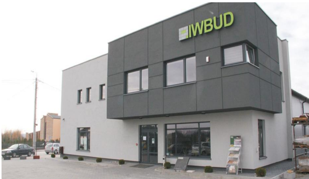
Siedziba Firmy IWBUD hurtownia materiałów budowlanych w Starym Opolu