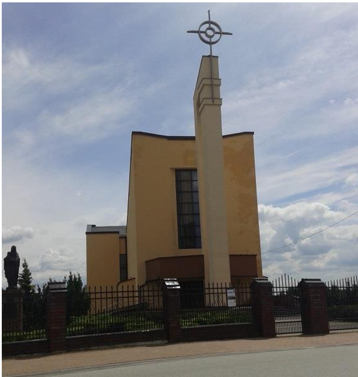
Kościół w Starym Opolu, Parafia Matki Bożej Nieustającej Pomocy.