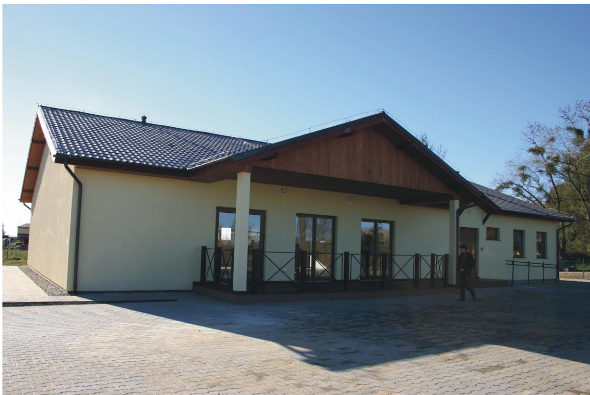
Projekt świetlicy wiejskiej w Starym Opolu

Po wybudowaniu świetlicy wiejskiej mieszkańcy wsi Stare Opole będą mogli z niej aktywnie korzystać. Będzie można w niej przeprowadzać różne szkolenia, kursy, spotkania informacyjne z ciekawymi ludźmi, a także będzie możliwość organizacji kół zainteresowań i zajęć pozaszkolnych dla dzieci i młodzieży.