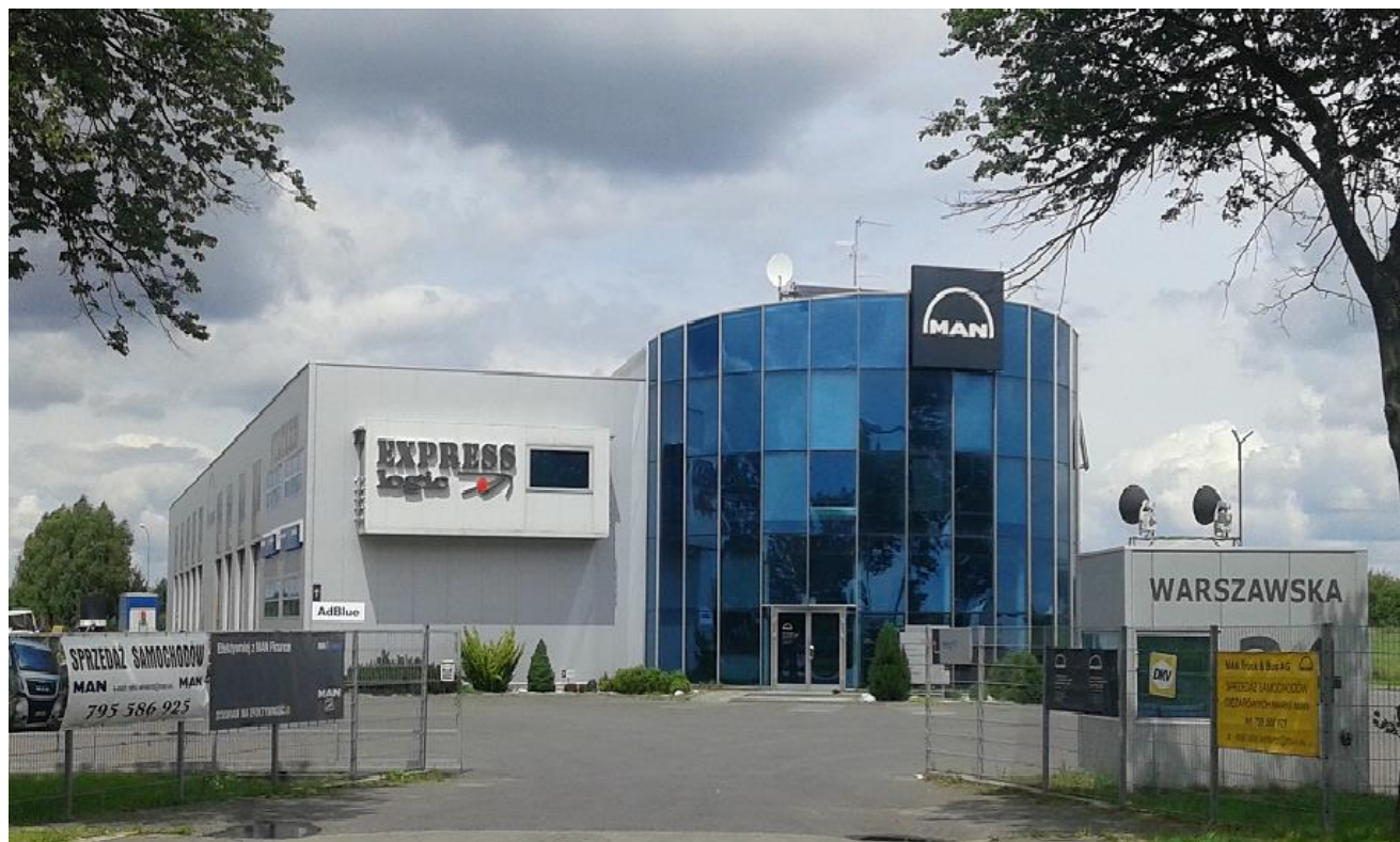
Siedziba Firmy EXPRESSLOGIC Spółka Jawna w Starym Opolu

Firma EXPRESSLOGIC Spółka Jawna powstała w 1994 roku i chodź od jej powstania minęło zaledwie 18 lat, zdołała zbudować znaczącą pozycję na rynku przewozów drogowych w relacji Wielka Brytania - Rosja. Przez cały ten okres firma inwestowała w modernizację floty oraz infrastruktury, w wyniku czego powstało nowoczesne przedsiębiorstwo logistyczne zorganizowane w cztery wyspecjalizowane działy i obejmujące zasięgiem działania Europę oraz część Azji. Nowoczesna flota 100 własnych pojazdów wsparta technologią komunikacji i lokalizacji z kompleksowym zapleczem serwisowym pozwala na profesjonalne i kompleksowe jej zarządzanie oraz terminowość / niezawodność świadczonych usług. Atutem EXPRESSLOGIC jest posiadanie w ramach floty zróżnicowanego taboru, w tym naczep standard, mega oraz chłodni przystosowanych do transportu towarów w temperaturze kontrolowanej. Działalność EXPRESSLOGIC jest dedykowana dla sektora małych, średnich i dużych przedsiębiorstw, które zdecydowały się na outsourcing usług transportowych / logistycznych. EXPRESSLOGIC gwarantuje ciągłość realizacji umów przewozu do Rosji, na Białoruś i Ukrainę z racji posiadania wielokrotnych zezwoleń - CEMT/EKMT na wykonywanie przewozów do w/w państw (ruch w obrębie UE odbywa się bez zezwoleń).